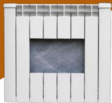
Découpe de KÉALITE, détail du coeur en stéatite.